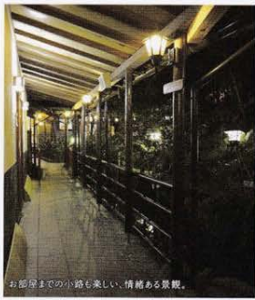
お部屋までの小路も楽しい、情緒ある景観。