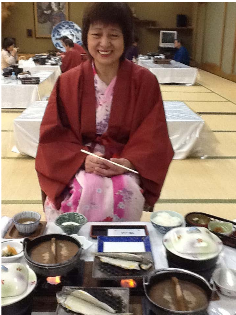
朝ご飯:おかずが一杯