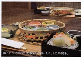
掘ごたつ造りの格食亭でゆったりとした時間を。