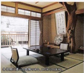
各別室に備えられた浴巾、お部屋の床柱。