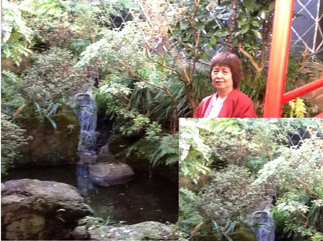
旅館内の橋のたもとで